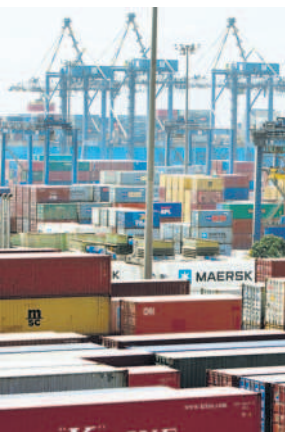
India's trade deficit for Oct stood at $8.8 billion.

The merchandise exports growth that India witnessed in September after a gap of six months could not be sustained in October, with outbound shipments contracting 5.4% as many of the European markets imposed fresh lockdown measures with a second wave of coronavirus infections sweeping the continent. Exports fell to $24.8 billion, while imports contracted 11.6% to $33.6 billion, resulting in a trade deficit of $8.8 billion, according to preliminary data released by the commerce ministry. India's merchandise trade was weakening even before the covid-19 outbreak due to declining external demand. In 14 of the past 16 months, starting June 2019, the country's exports were in the negative. Since March 2020, both exports and imports started falling in high double digits, temporarily leading to a trade surplus in June for the first